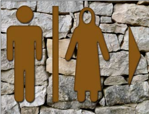
In basso: toilette, segnali dall'Iran.