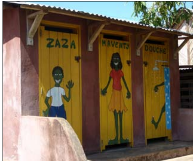
Toilette nel villaggio di Koulikoro, Mali.

Basta dare un'occhiata ad alcune immagini del percorso laboratorio didattico " Scappa ... a chi scappa ", realizzato dall'Associazione Mani Altri Sguardi , per scoprire quanto la fantasia e la genialità delle persone abbiamo saputo produrre per andare incontro ai "bisogni" dei propri simili!