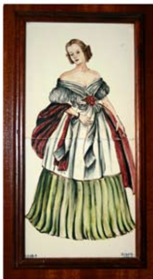
In alto: toilette, segnali dal Portogallo. In basso: toilette, segnali dall'Inghilterra.