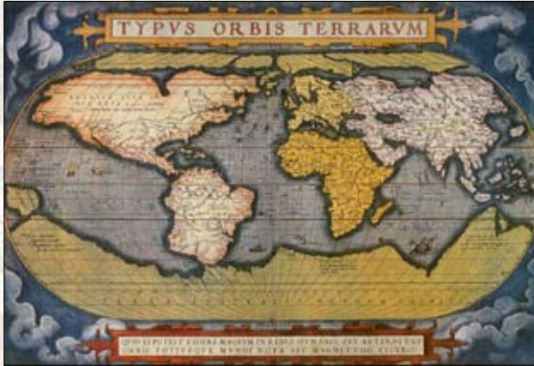
Planisfero disegnato da Ortelio nel 1600 circa.

Il primo percorso della mostra è quello costituito dalla trattazione cronologica della storia cartografica.