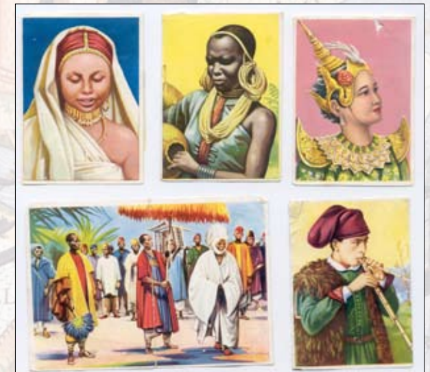
Album di figurine "Le razze umane", Lampo Edizioni, Italia 1956.

In ogni epoca le rappresentazioni del mondo hanno camminato di pari passo con le rappresentazioni degli "esseri umani" che navigatori e viaggiatori europei incontravano nel corso delle loro esplorazioni. In questo modo, nell'immaginario collettivo europeo, dopo il 1500 fiorirono le rappresentazioni dell'"altro", dell'uomo dissimile dallo spagnolo, dall'olandese, dal portoghese. Rappresentazioni che non mancarono di suscitare attrazioni, ripulse e che, in ultima analisi, costituirono le basi del razzismo e dell'antisemitismo che dilagarono in Europa a partire dal XVIII secolo.